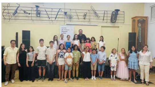
Pianos y Cellos