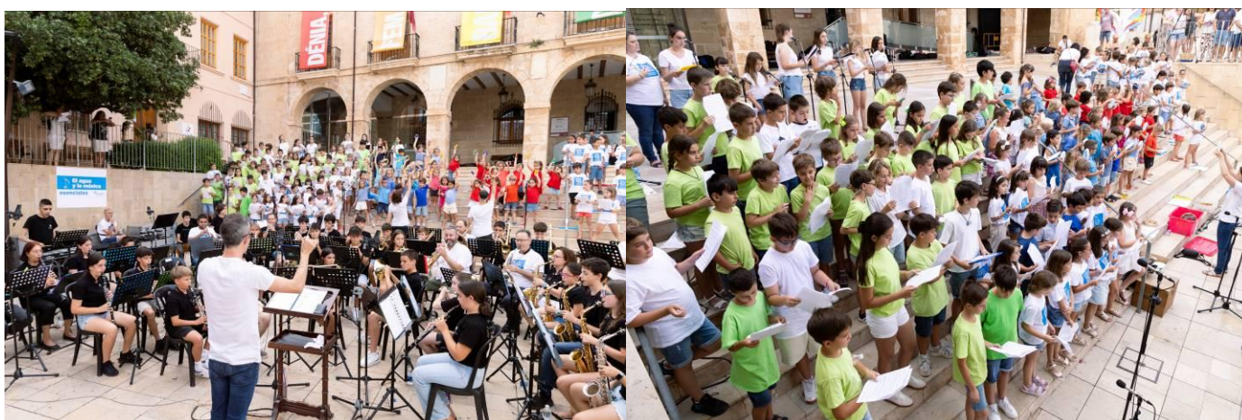
Banda Juvenil, alumnos Jardín Musical i, II, y III y de coro de lenguaje musical

Con este proyecto, la música se ha consolidado como una poderosa herramienta educativa para transmitir valores medioambientales y fomentar una conciencia colectiva sobre la sostenibilidad.