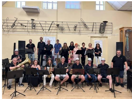
Combo y Grupo Instrumental de adultos