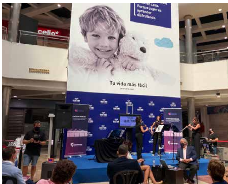
Presentació de Sanimusic a València