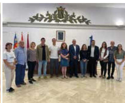
Concert Generalitat Valenciana