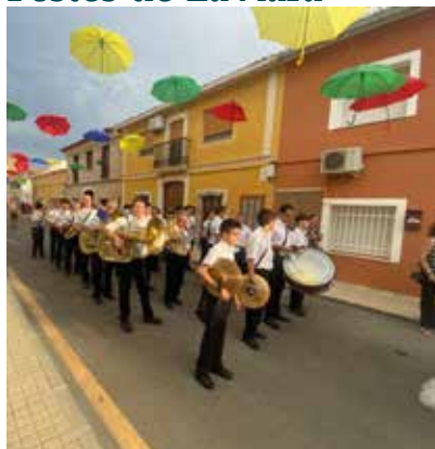
Presentacions Ff Mm de Dénia